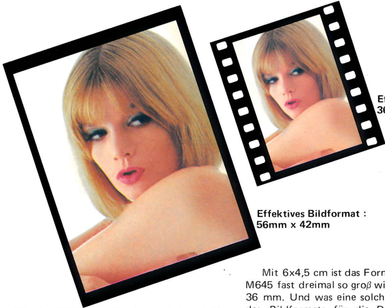
Effektives Bildformat : 56mm x 42mm

Mit der M645 hat Mamiya — bekannt für seine zuverlässigen und vielseitigen Berufskameras — einen völlig neuen Kamertyp geschaffen: die einäugige Spiegelreflexkamera für das feste Format 6x4,5 cm und die Verwendung von Rollfilm 120 bzw. 220 eine Präzisionskamera, welche die überlegene Leistung eines relativ großen Bildformats mit modernster technischer Ausstattung und einem Bedienungskomfort verbindet, wie ihn der aktive Fotograf vom wesentlich kleineren Kleinbild her gewöhnt ist.