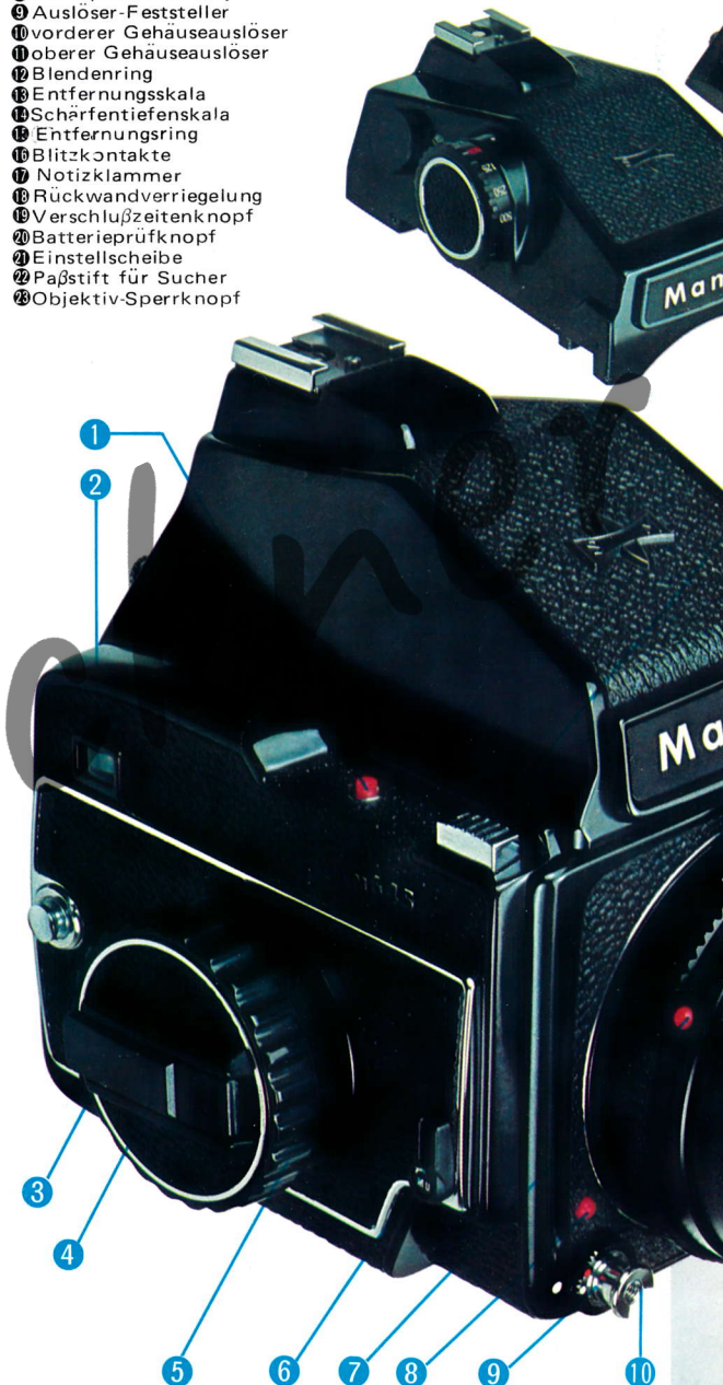
Mit Prismensucher PD

system. Je nach den Gegebenheiten läßt sich die Kamera so durch Verwendung eines Lichtschachtsuchers, Prismensuchers oder Prismensuchers PD mit Innenmeßsystem mit wenigen Handgriffen optimal ausrüsten.